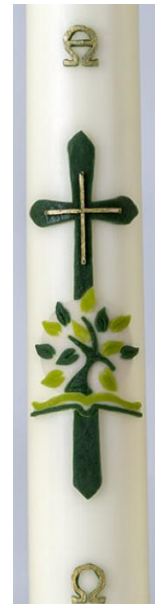
Detail van de Paaskaars 2026

Toelichting: Dalits staan onderaan de maatschappelijke ladder in India. Veel Dalit-kinderen komen op school niet mee omdat ze met de nek worden aangekeken. Of ze stoppen door armoede vroegtijdig met school om te werken. De organisatie Cards begeleidt kinderen (terug) naar school. Kerk in Actie ondersteunt dit.