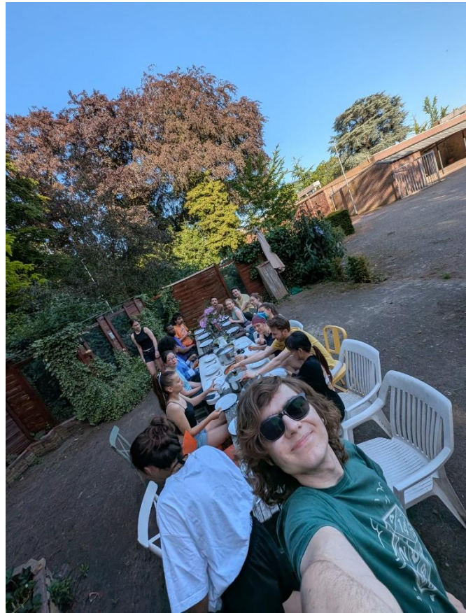
Foto van de leefgemeenschap

Omdat we intensief samenwerken en ze tijdens hun stage ook echt met zichzelf aan de slag gaan (en ook mee mogen kijken in ons leven), komen we heel dicht bij elkaar en zien ze in ons leven hoe Hoop, Liefde, Geloof praktijk worden. Zij helpen ons om bij de tijd te blijven en hebben elk hun eigen unieke creatieve inbreng in het werk van Vita. In juni ronden ze hun stage af met presentaties en verslagen. Maar ook met een ochtendje zelfreflectie en delen van wat ze over zichzelf geleerd hebben bij Vita het afgelopen half jaar.