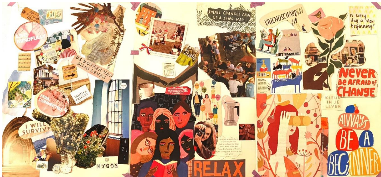
Moodboard gemaakt door vrijwilligers over wat ze opgedaan hebben bij Vita