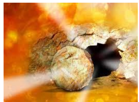
Paasen, het feest van de opstanding