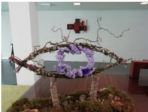
bloemschikking van de 4e zondag in de Veertigdagentijd