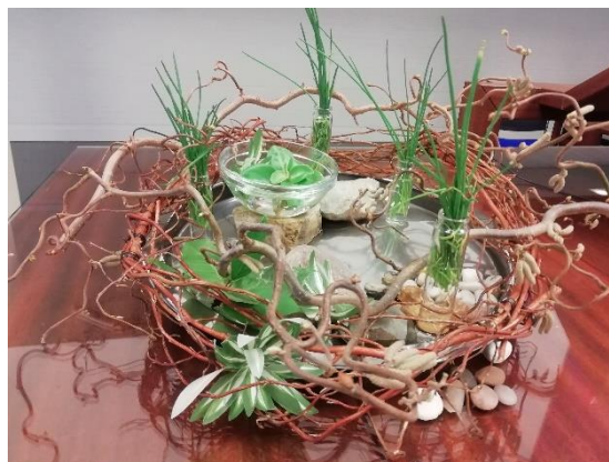
bloemschikking van de 3e zondag in de Veertigdagentijd

Dat je de vruchten van je leven proeft en gaat in vrede.