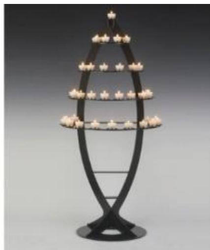
Devotieboom in de Opstandingskerk

De mensen van voorbij zij worden niet vergeten. De mensen van voorbij zijn in een ander weten. Bij God mogen ze wonen, daar waar geen pijn kan komen. De mensen van voorbij zijn in het licht, ... zijn vrij.