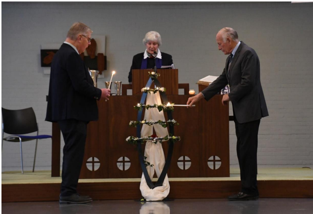
Bij het noemen van de namen werd voor de overleden gemeenteleden een kaarsje aangestoken