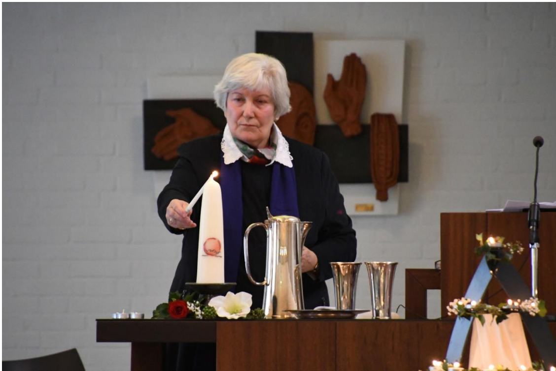
Er werd een grote Gedachteniskaars aangestoken voor de mensen die ons al eerder zijn overleden